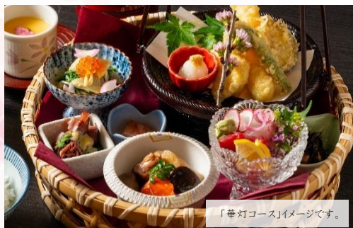
「華灯コース」イメージです。

博多駅から徒歩1分 ご接待や慶事の席として選ばれる『海鮮処 松月亭 博多本店』 叶わなかった春の宴を、時期をずらした今だけの特別プランで。 幹事様に寄り添う3つの限定コースが、大切なご接待や母の日などの記念日を華やかに演出します。