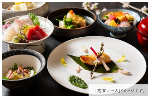
「志賀コース」イメージです。

少し時期をずらした今だからこそ、 実現した充実の内容で、 どのシーンでもご利用いただけます。 歓送迎会、まだ間に合います！ この機会に是非ご利用ください。